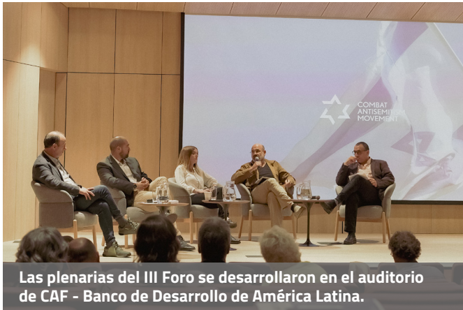
Las plenarios del III Foro se desarrollaron en el auditorio de CAF - Banco de Desarrollo de América Latina.

La tercera versión del Foro de Latinoamérica e Israel se llevó a cabo en Montevideo, Uruguay. El evento contó con representantes de 17 países, entre los que se encontraban: Argentina, Bolivia, Brasil, Chile, Colombia, Costa Rica, España, Guatemala, Israel, Panamá, Estados Unidos, Venezuela, Uruguay, México, El Salvador y Honduras.