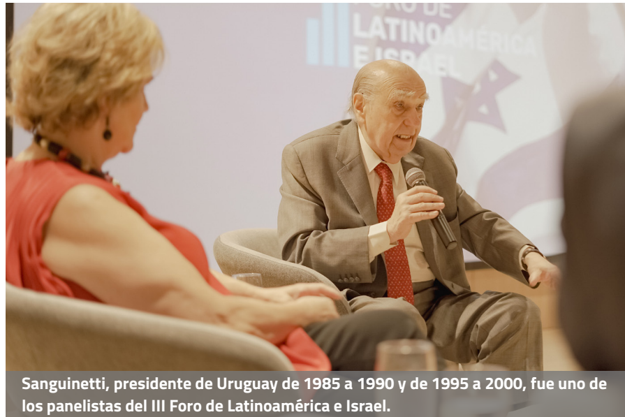
Sanguinetti, presidente de Uruguay de 1985 a 1990 y de 1995 a 2000, fue uno de los panelistas del III Foro de Latinoamérica e Israel.

El ex presidente de Uruguay, doctor Julio María Sanguinetti, compartió el escenario con la periodista española Pilar Rahola en un panel que abordó el tema central: “Antisemitismo versus Antisionismo: Dos lados de la misma moneda”.