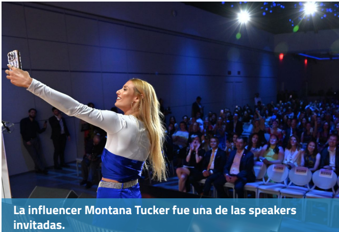
La influencer Montana Tucker fue una de las speakers invitadas.