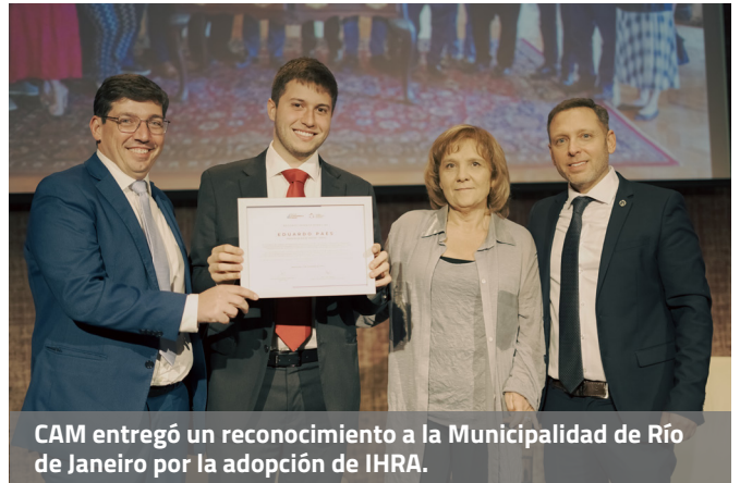
CAM entregó un reconocimiento a la Municipalidad de Río de Janeiro por la adopción de IHRA.