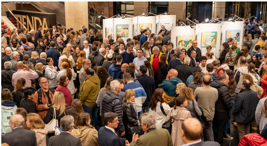
La muestra artística "No Discriminarás" busca resaltar la importancia de la lucha contra las diferentes expresiones de odio y discriminación en el mundo.