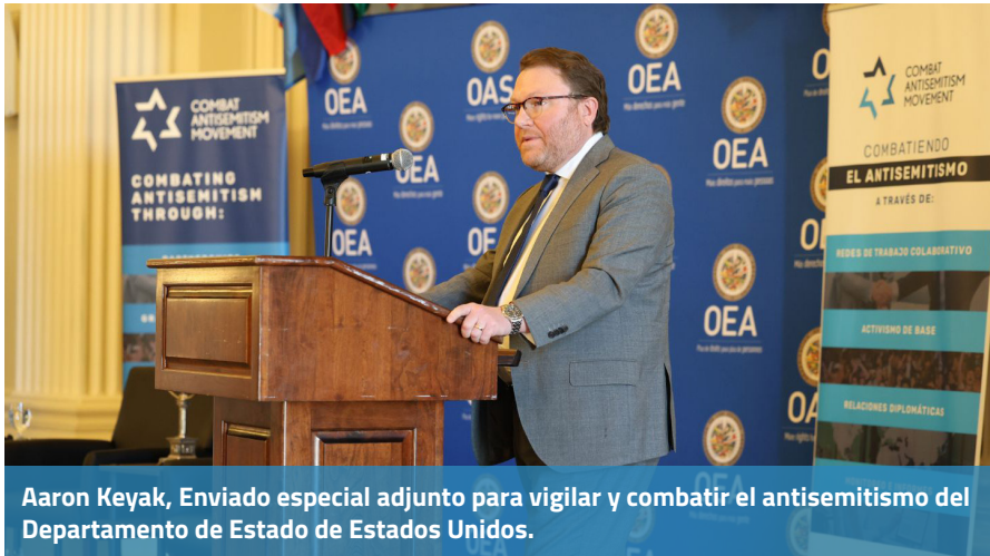
Aaron Keyak, Enviado especial adjunto para vigilar y combatir el antisemitismo del Departamento de Estado de Estados Unidos.

El enviado especial adjunto para vigilar y combatir el antisemitismo del Departamento de Estado de Estados Unidos, Aaron Keyak afirmó que “atacar a las comunidades judías con odio y violencia no es proteger los derechos de los palestinos, es antisemitismo. No hay ningún contexto en el que pedir el genocidio de los judíos no sea antisemita”.