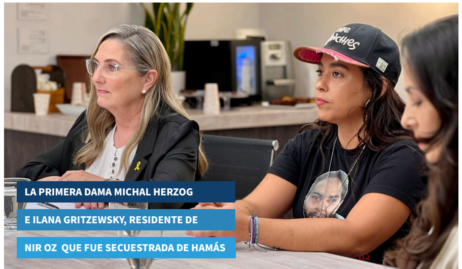
LA PRIMERA DAMA MICHAL HERZOG