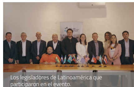
Los legisladores de Latinoamérica que participaron en el evento.