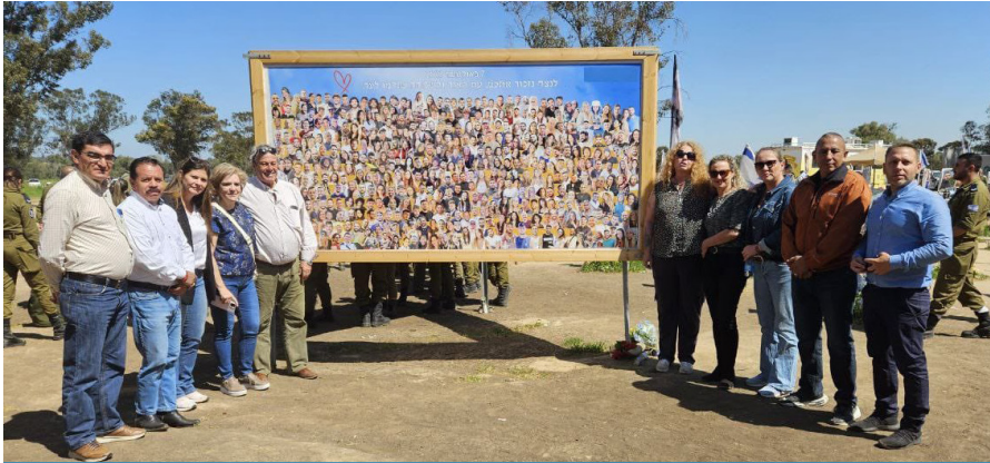
La delegación visitó el lugar donde se realizaba el Festival de Música Nova.

Como respuesta al aumento del antisemitismo en la región, CAM llevó a Israel a una delegación de alcaldes y gobernadores latinoamericanos para una visita de solidaridad tras el 10/7.