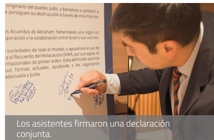
Los asistentes firmaron una declaración conjunta.

Los participantes del Foro además asistieron al servicio conmemorativo de Kristallnacht en la Nueva Congregación Israelí de Montevideo. Y como cierre, se realizó la firma de una declaración conjunta sobre “el fortalecimiento de los vínculos entre las naciones latinoamericanas e Israel en todos los ámbitos”.